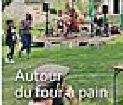
Autour du four à pain