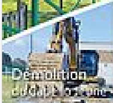
Démolition du bâtiment ancien